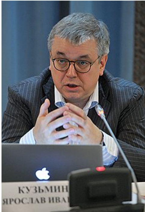
Ректор НИУ "Высшая школа экономики" Ярослав Кузьминов

Правительство утвердило проект нового трехлетнего бюджета. Из-за торможения экономики будут урезаны расходы, заморожены тарифы естественных монополий, а также пересмотрена недавняя пенсионная реформа. "Власть" спросила экспертов, участвовавших в разработке "Стратегии-2020", насколько эффективны принятые правительством меры по сокращению бюджета и может ли нынешний спад заставить власти пойти на системные реформы.