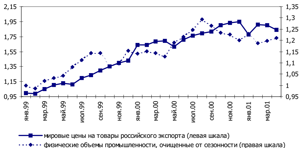
Мировые цены и промышленное производство в 1999-2001 гг. (янв. 99=1)

Источник данных: Госкомстат; расчеты МВФ; расчеты автора